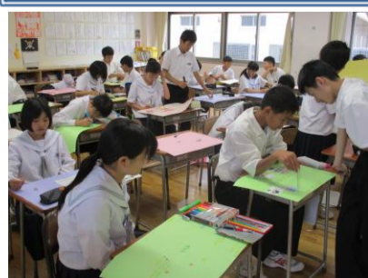
ドリームマップ作成