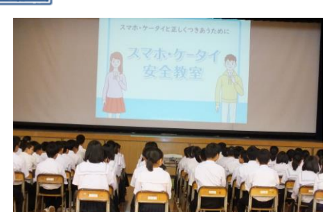
スマホ・ケータイ安全教室