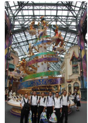
ディズニーランドにて