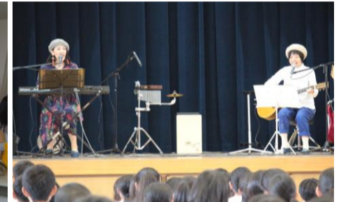
ナナ・イロ ライブ