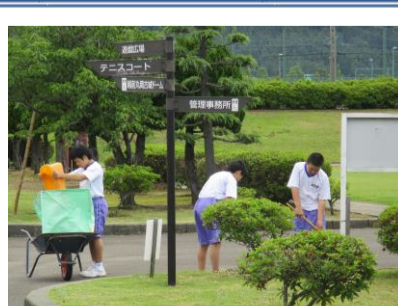
校外清掃ボランティア