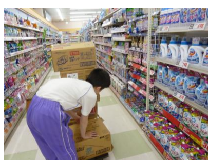
スーパーでの体験