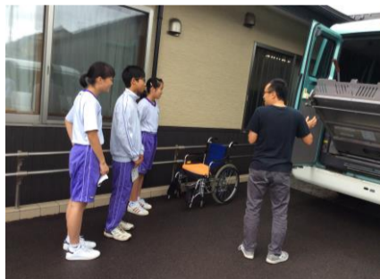
養護施設での体験